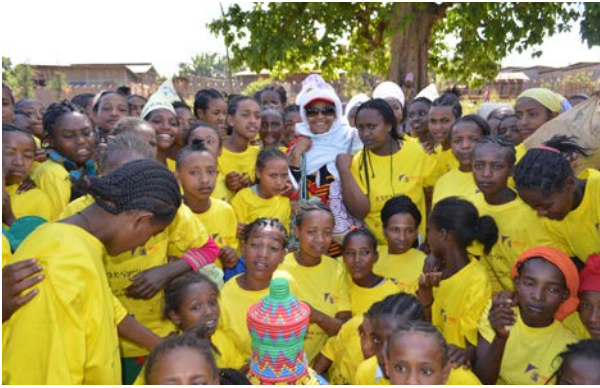
Die Uncut-Girls-Groups sind unbeschnittene Mädchen in Durame, die sich für das Beenden der Genitalverstümmelung stark machen.