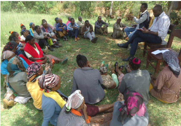
Bei den wöchentlichen Community Meetings kommen Rain Worker in die Dorfgemeinschaften und setzen sich mit den Menschen zusammen.