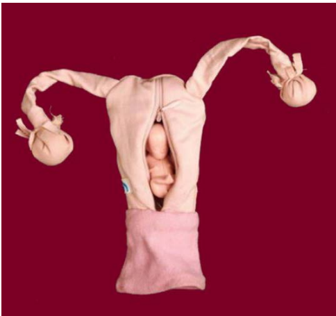
Die Little Mom erklärt begreifbar und enttabuisiert die weibliche Anatomie.