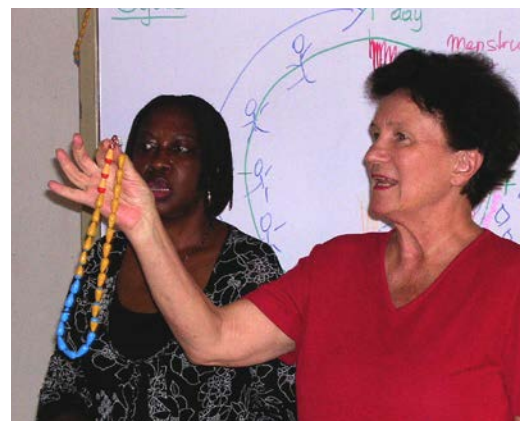
Das Konzept der Aktion Regen ist aufgebaut und wird in 12 Projektländern in West- und Ostafrika von rund 700 Rain Workern umgesetzt.

ist gleichermaßen das Wasser an den Wurzeln. Sie sind die BrückenbauerInnen zwischen den Kulturen, die in der Sprache des Volkes lehren und beraten.